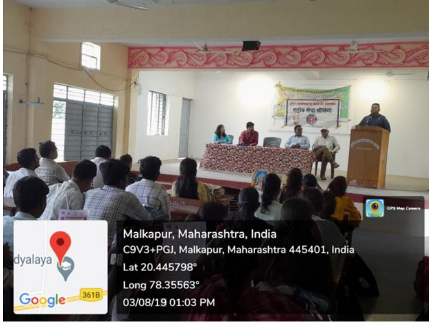
Participants Engaged in a Listening Session on Sickle Cell Disease

namo.maharashtra@hotmail.com नमो महाराष्ट्र